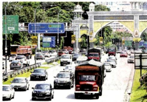
Individu yang bekerja di luar daerah perlu mempunyai pas pekerja yang sah atau surat kebenaran daripada majikan.

"Bagi pekerja dari dalam daerah yang sama, mereka tidak perlu mengemukakan surat majikan atau pas pekerja. Individu yang menggunakan pergerakan udara melalui Lapangan Terbang Antarabangsa Kuala Lum-