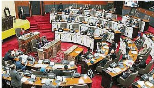
第十四届第三季第三次雪州议会会议将于11月2日召开，并提前于10月30日提呈雪州明年度的财政预算案。（档案照）