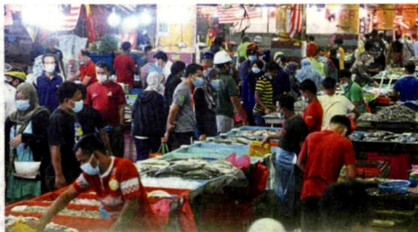
Stocking up: People buying seafood at Pasar Borong Selangor in preparation for the conditional MCO mandated for Selangor, Kuala Lumpur and Putrajaya.

Unlike the previous stringent lockdown in March, he said the conditional MCO provided some