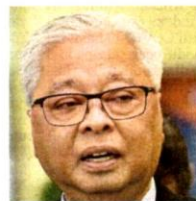
Ismail Sabri Yaakob