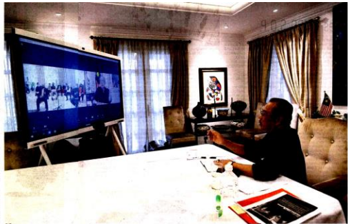
Prime Minister Tan Sri Mahathir Mohamad at the video conference at his residence in Kuala Lumpur yesterday.

PUTRAJAYA, Oct 14 — Prime Minister Tan Sri Mahathir Mohamad said today that the government's decision to impose a Conditional Movement Control Order (CMCO) in Selangor, Kuala Lumpur and Putrajaya is "the right move" to prevent the spread of Covid-19 cases in the region, including the capital. He said the government was not willing to wait until the situation became worse before taking action. "I am not a doctor, but I know that the government has to act now to prevent the situation from getting worse," he said. He said the government was not willing to wait until the situation became worse before taking action. "I am not a doctor, but I know that the government has to act now to prevent the situation from getting worse," he said.