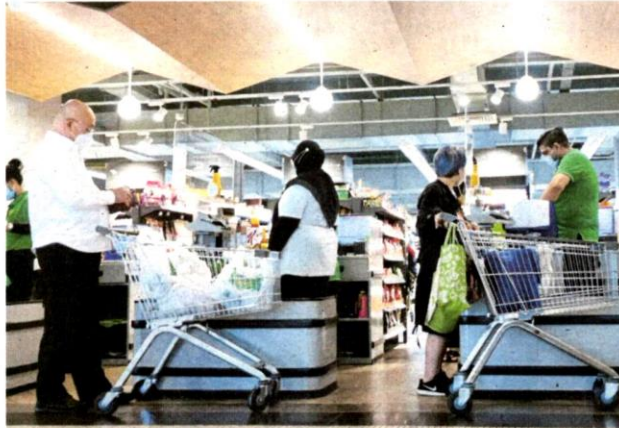
Orang ramai membeli barangan keperluan di sebuah pasar raya di Bangsar berikutan pelaksanaan PKPB di Kuala Lumpur, Selangor dan Putrajaya bagi menangani penulanan COVID-19.