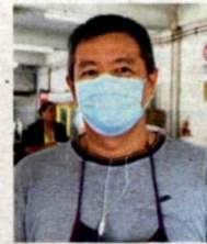
How says MPK's ruling to disallow stalls from trading along the five-foot-way is good for cleanliness and hygiene.

"Once this is done, their business will continue and the hawkers can offer takeaway. "We want total compliance and cooperation to stem the spread of Covid-19," he said.